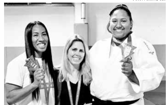
Brasileiras exibem, com orgulho, as medalhas conquistadas em Abu Dhabi