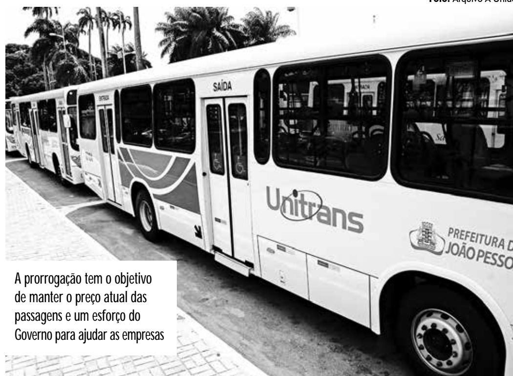
A prorrogação tem o objetivo de manter o preço atual das passagens e um esforço do Governo para ajudar as empresas

O benefício fiscal estabelecido no decreto para as empresas concessionárias de transporte coletivo será revogado na hipótese de descumprimento das obrigações ou exigências impostas neste Decreto e na legislação tributária estadual.