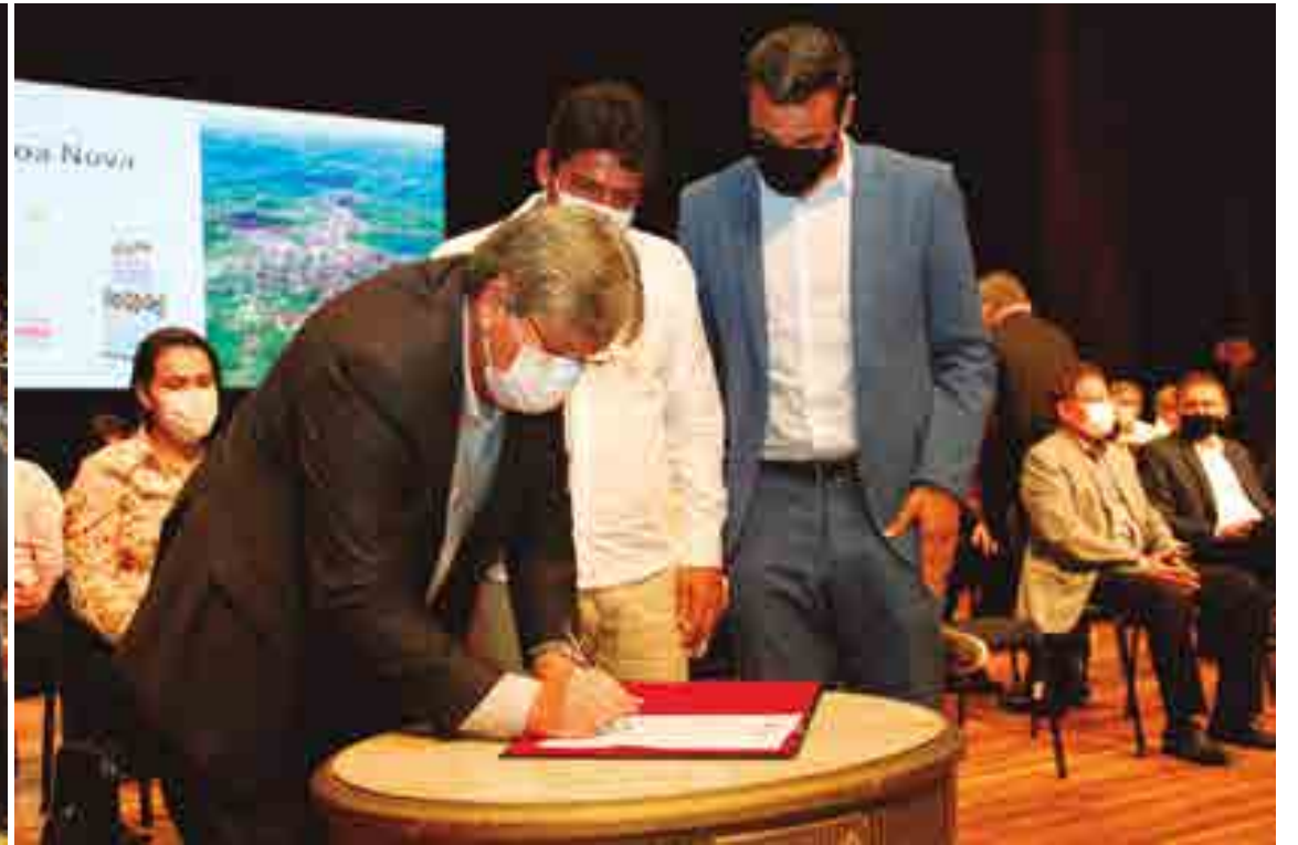
Área reservada no Espaço Cultural para a solenidade de assinatura, pelo governador João Azevêdo, dos investimentos na construção de 104 creches ficou lotada; projeto é uma parceria do Governo do Estado com prefeituras municipais