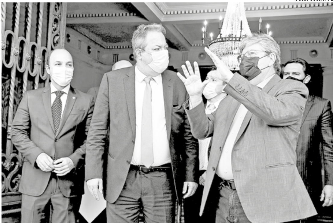
Corregedor nacional do Ministério Público, Marcelo Weitzel, encontra o governador João Azevêdo no Palácio da Redenção

Na oportunidade, o governador ressaltou o trabalho integrado das forças de Segurança que tem resultado no reforço e reestruturação do segmento e a injeção de recursos na tecnologia e na valorização de pessoal. “Temos aprimorado, cada vez mais, a nossa atuação, com investimentos de R$ 100 milhões nos Centros Integrados de Comando e Controle em João Pessoa, Patos e Campina Grande, nas 1.600 câmeras com reconhecimento facial e identificação de placas de veículos, promovemos mais de cinco mil policiais e estamos fazendo o concurso da Polícia Civil, com 1.400 vagas”, frisou. O secretário de Estado