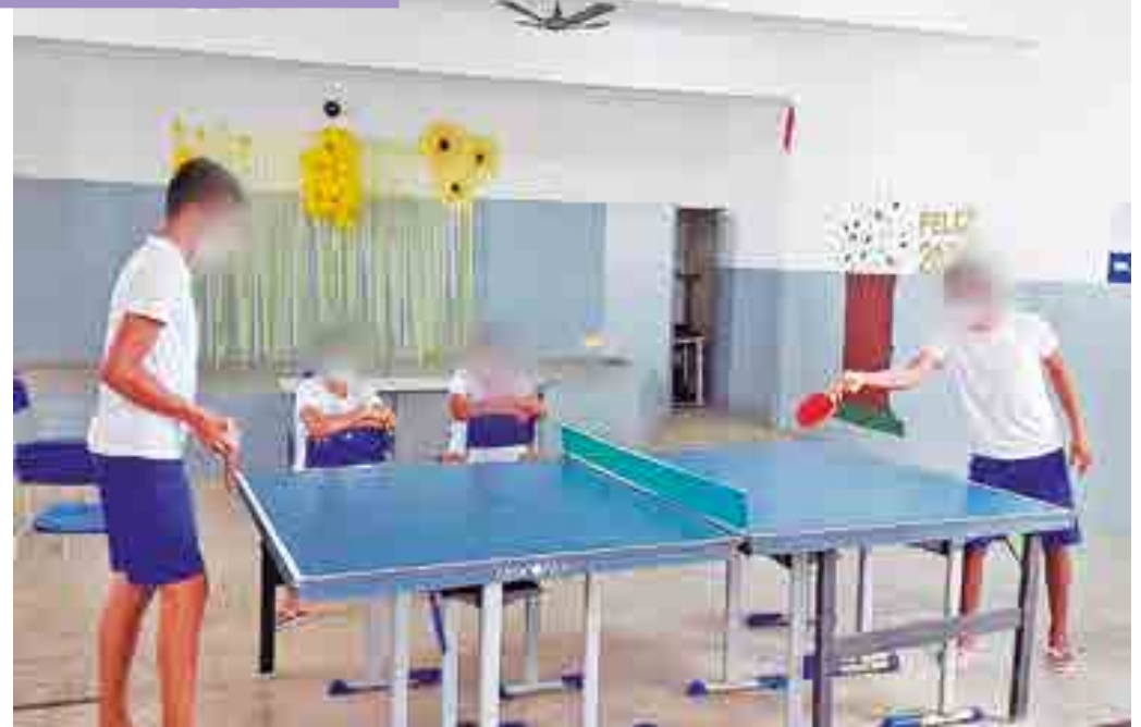
Iniciativa de promover o Torneio de Tênis de Mesa partiu de aulas ministradas sobre a modalidade esportiva