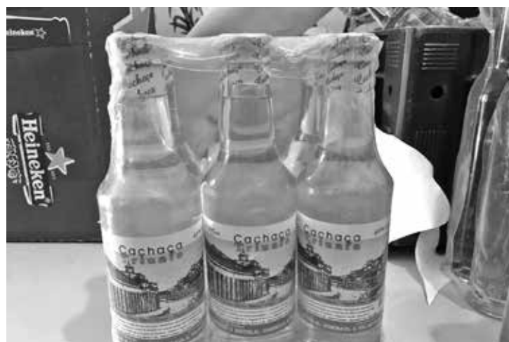
Uma pessoa foi presa no local onde funcionava o depósito e outras três, em Jacaraú; polícia também apreendeu equipamentos usados na adulteração de bebidas