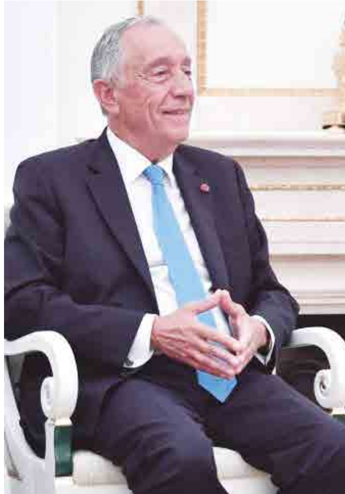
Marcelo Rebelo de Sousa anunciou o veto na última segunda-feira