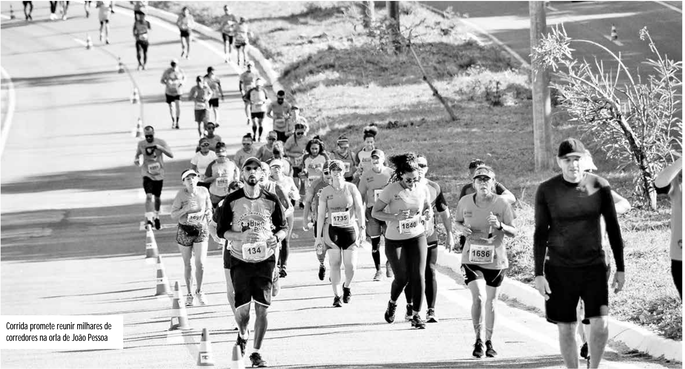
Corrida promete reunir milhares de corredores na orla de João Pessoa