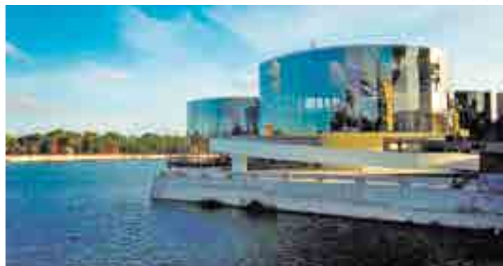
Museu dos Três Pandeiros (MAPP) terá projeção mapeada na sua fachada