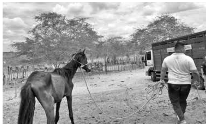
Animais foram encontrados desnutridos; polícia também localizou carcaças