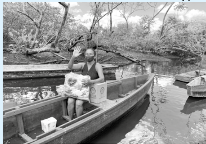
Campanha distribuirá cestas básicas com famílias carentes em várias cidades