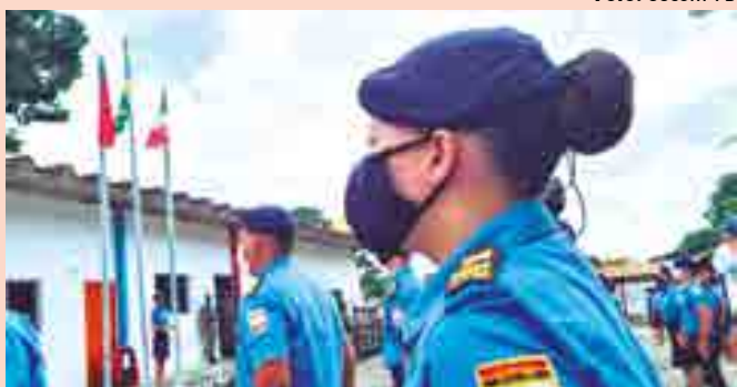
Para o próximo ano, estão sendo oferecidas 140 vagas a novos alunos